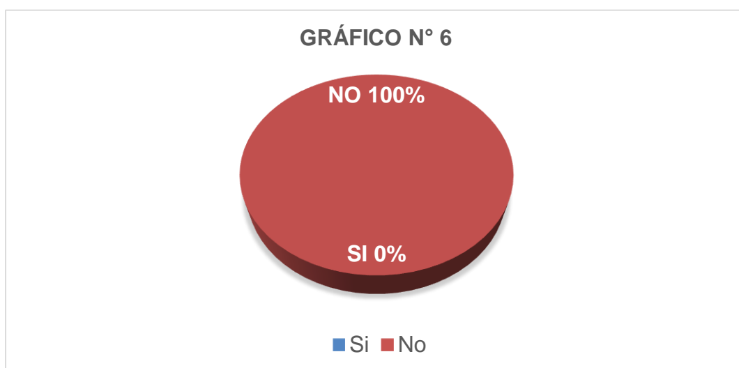
Gráfico N° 6