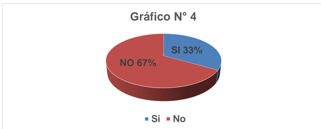
Gráfico N° 4