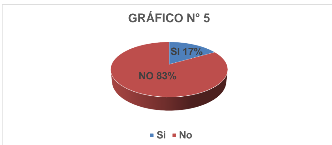
Gráfico N° 5