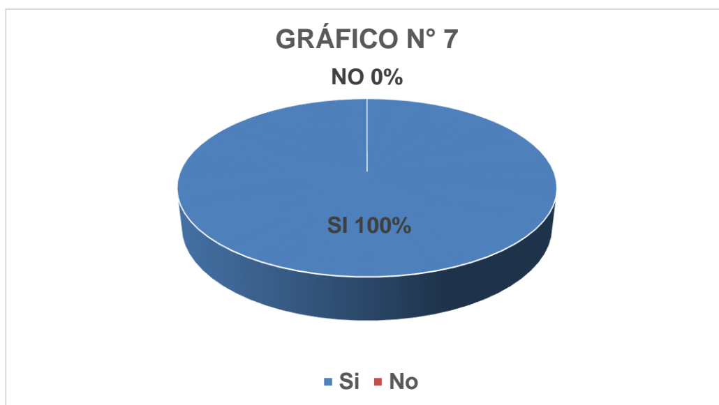
Gráfico N° 7

Fuente: Cuestionario Elaboración: El Investigador