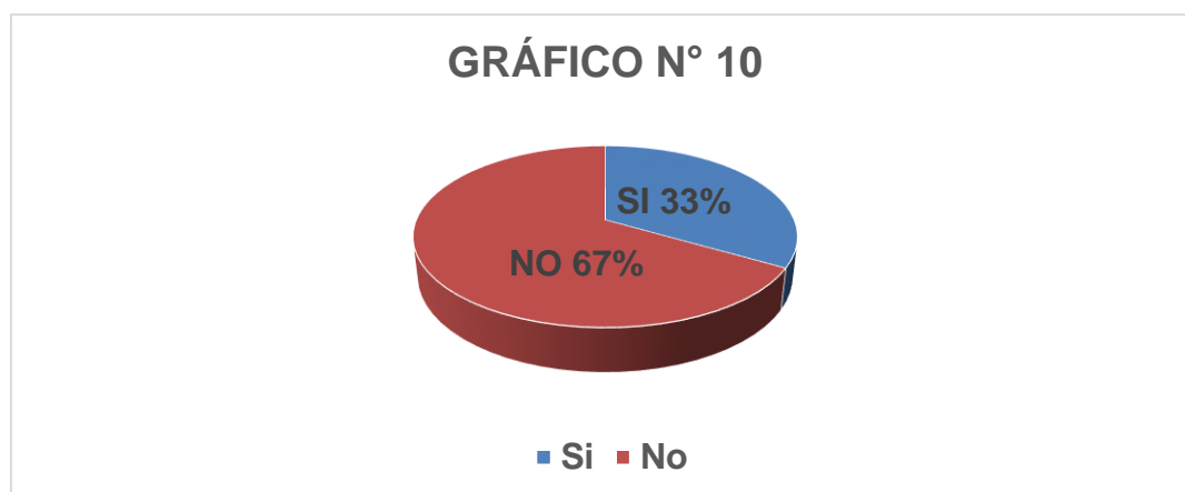
Gráfico N° 10

Fuente: Cuestionario Elaboración: El Investigador