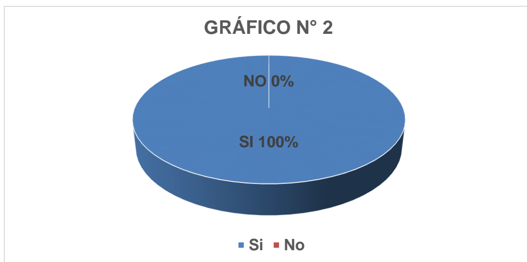
Gráfico N° 2