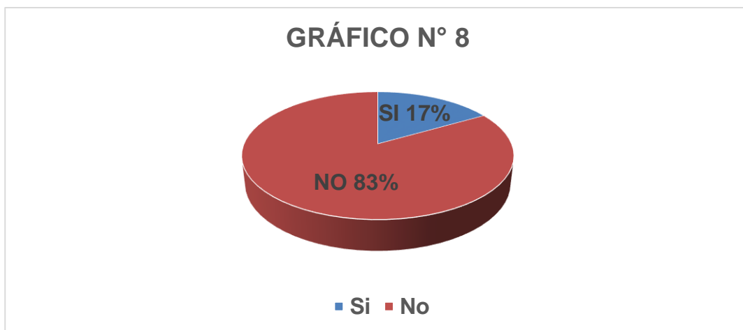
Gráfico N° 8