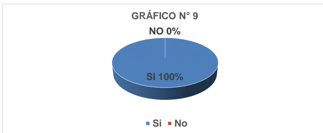
Gráfico N° 9