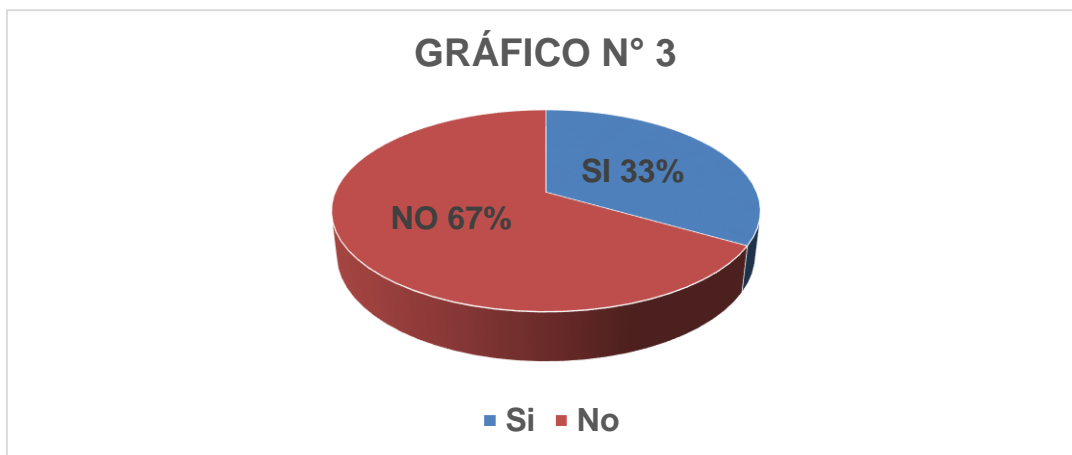
Gráfico N° 3