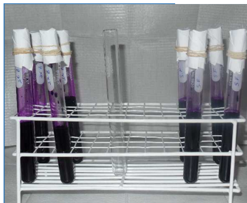
Tubos de ensayo con violeta de genciana