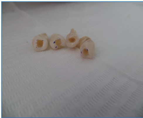
Cavidades realizadas a cada pieza dental