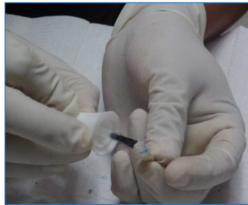
Aplicación de esmalte en las piezas dentarias