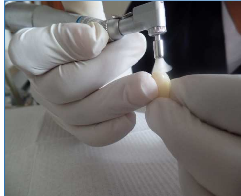
Realización de profilaxis de cada pieza dental