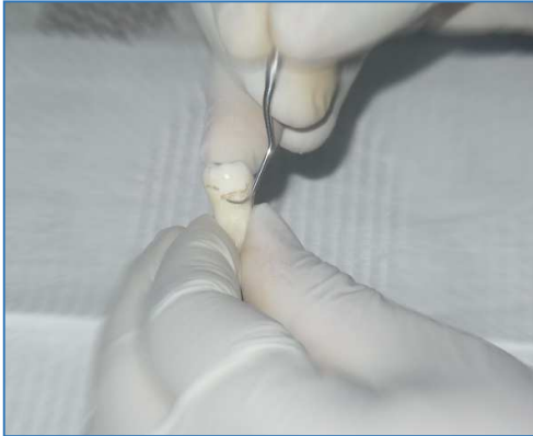
Realización del destartraje de cada pieza dental