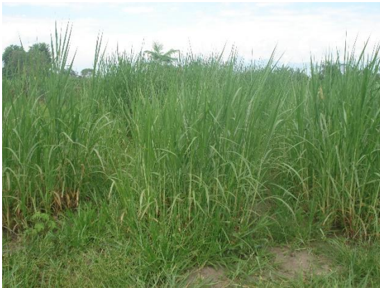
Crecimiento del forraje a las 6 semanas