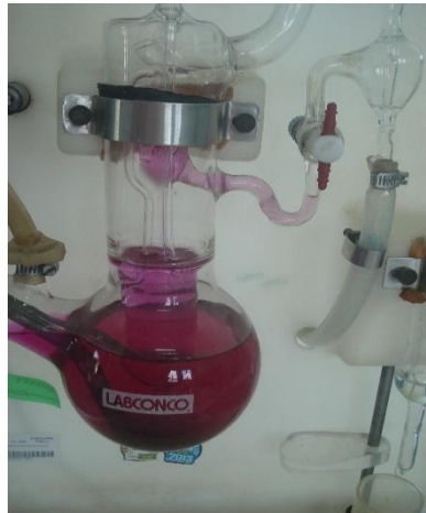
Análisis de materia orgánica