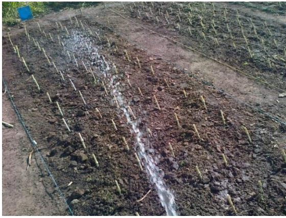
Siembra de la Maralfalfa

Anexo 1. Ejecución del Pasto Maralfalfa en diferentes dosis de abonamiento a las tres y seis semanas de edad.