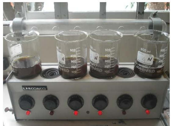
Análisis de fibra cruda