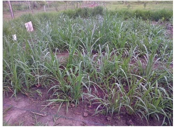
Crecimiento del forraje a las 3 semanas