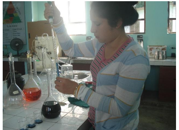
Análisis del forraje