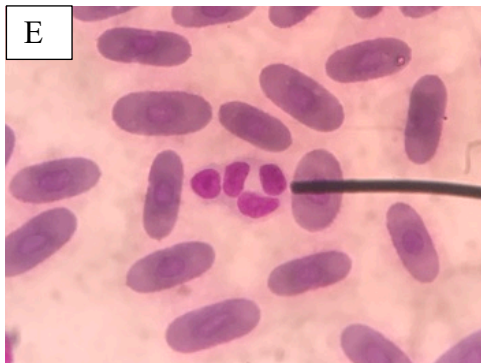
E. Agregación plaquetaria en una tortuga Geochelone denticulata