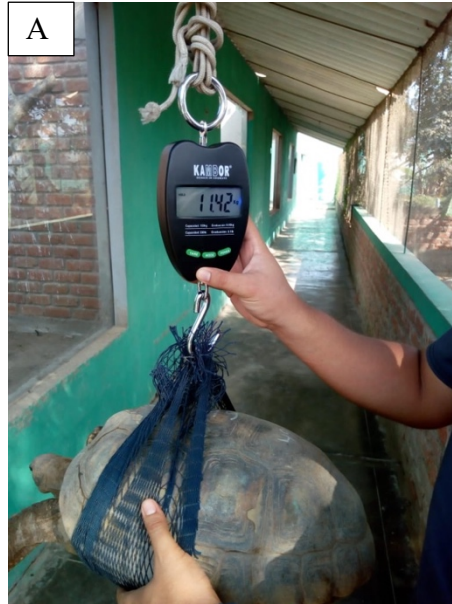
A. Pesaje de tortugas Geochelone denticulata