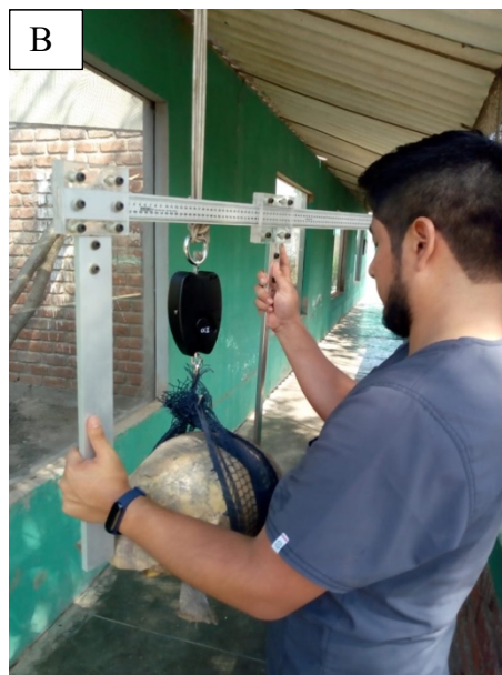
B. Medición de la longitud de caparazón de tortugas Geochelone denticulata