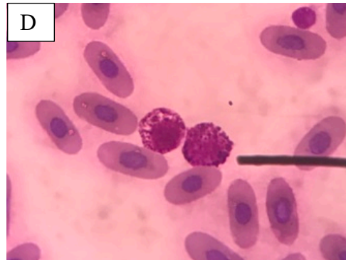
D. Basófilos de una tortuga Geochelone denticulata