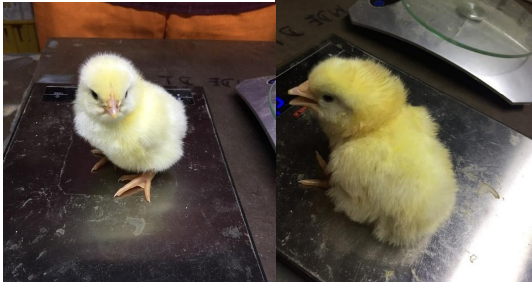
F. A la izquierda, pollo recién nacido de excelente calidad; a la derecha, pollo recién nacido de mala cal