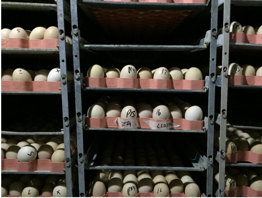
C. Ubicación céntrica de las jabas dentro de la incubadora