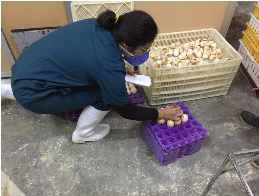
D. Clasificación de los huevos residuales para posterior embriodiagnosis