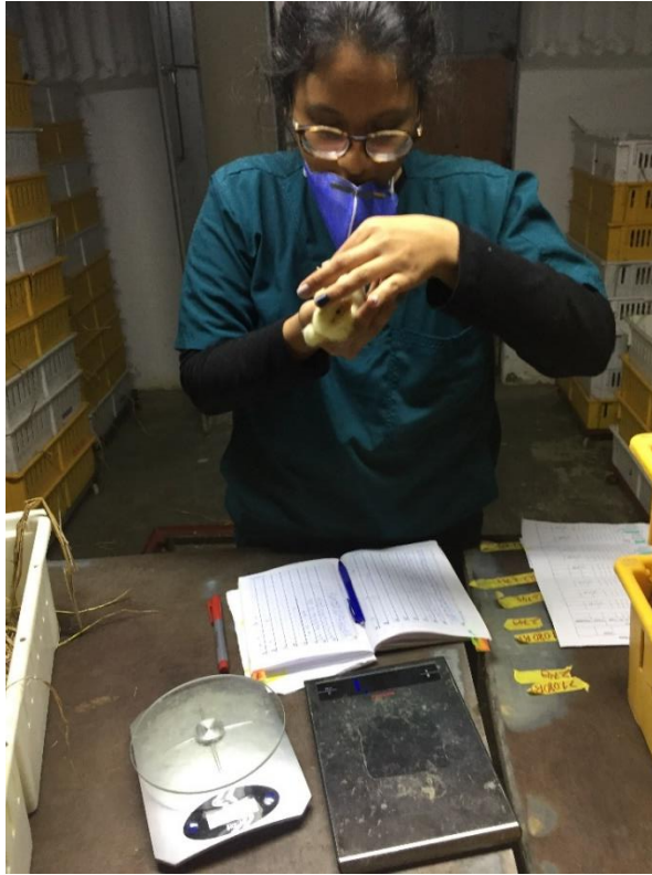
E. Evaluación física de Cervantes y pesado.