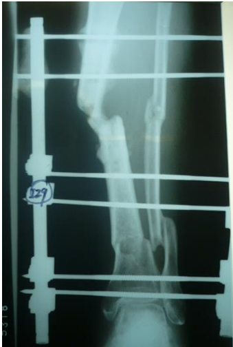
Fig. 1. Pseudoartrosis tibial izquierda, con presencia de fijadores externos

se hospitaliza para programación de retiro de fijadores externos (Fig. 2)