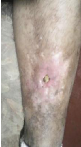
Fig. 5. 90 meses posoperatorio. Fístula con exposición de aloinjerto, pendiente de evaluación por cirugía plástica.