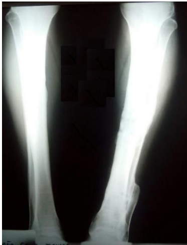
Fig. 4. Osteointegración completa de injertos en defecto de diáfisis tibial izquierda.

produciéndose la consolidación y controles favorables (Fig. 4).