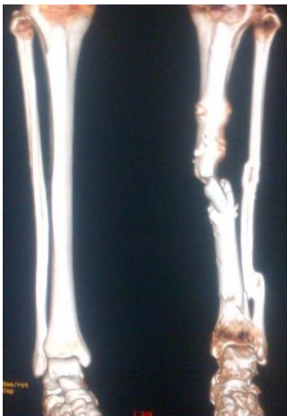
Fig. 2. Imágenes de reconstrucción tridimensional de pseudoartrosis atrófica de tibia izquierda, posterior al retiro de fijadores externos

se hospitaliza para programación de retiro de fijadores externos (Fig. 2)