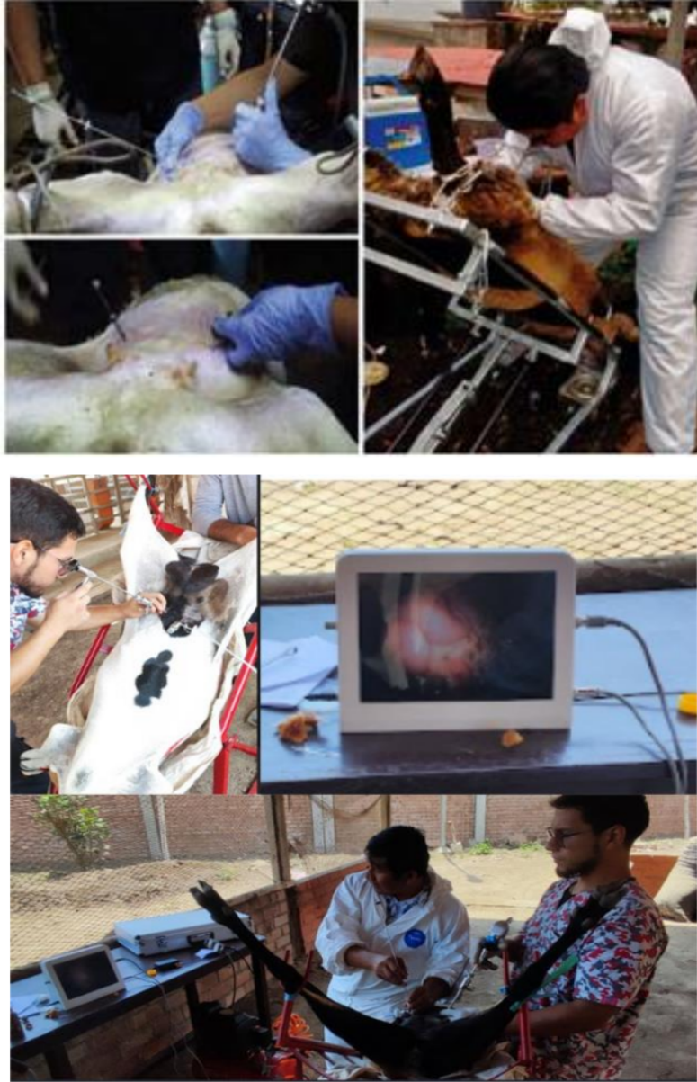
Anexo 1: Ejecución de la técnica de IAL.