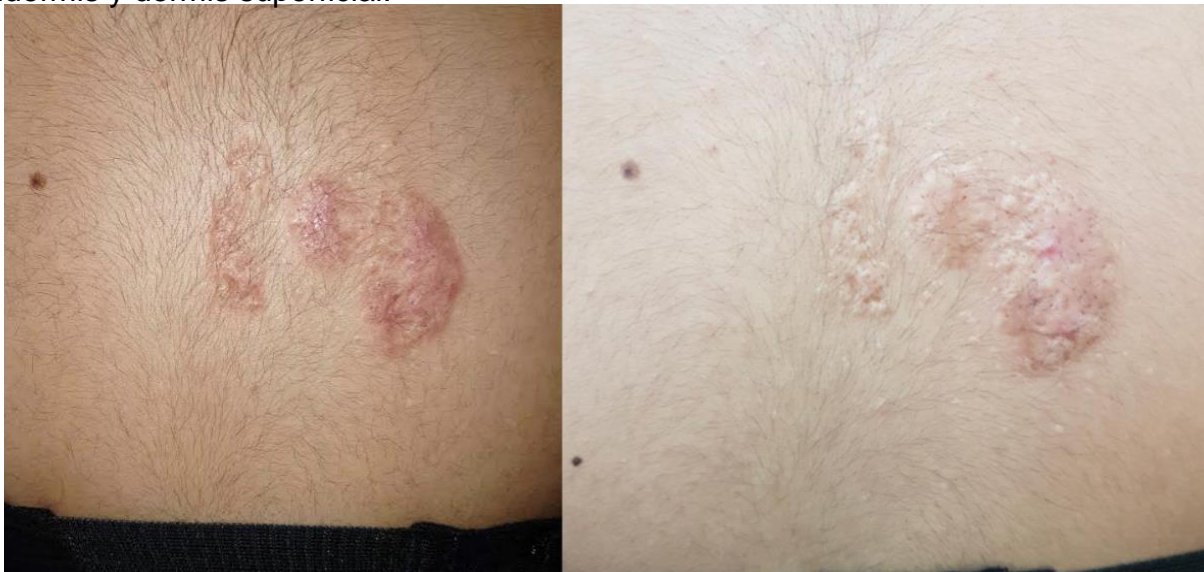
Figura 5 y 6. Evolución 5 y 11 meses después de tratamiento con Yoduro de potasio.