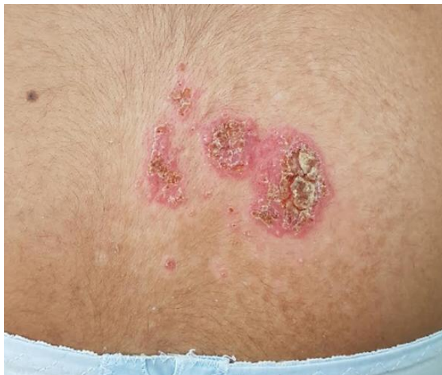
Figura 1. Placas de bordes de aspecto granulomatoso, con costras melicéricas y zona ulcerada en una de las placas en zona interescapular, acompañada de lesiones satélites.

La evolución fue estacionaria por la mala adherencia al tratamiento, y el cultivo para esporotricosis fue positivo. Se inició el tratamiento con Yoduro de potasio, iniciando con 5 gotas por 5 días y subiendo 5 gotas cada 5 días, siendo este tratamiento efectivo. (Fig.3)