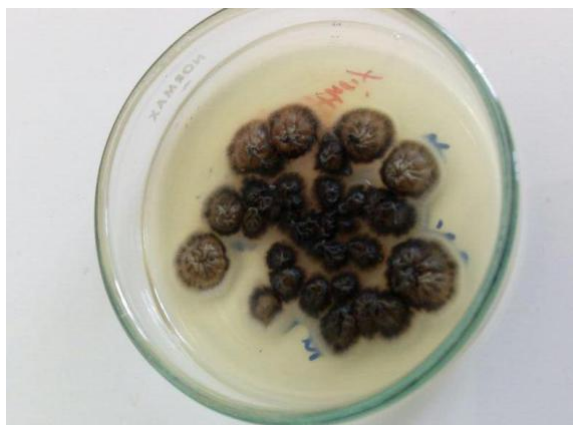
Figura 2. Medio de cultivo Agar Dextrosa Sabouraud 2% positivo para esporotricosis