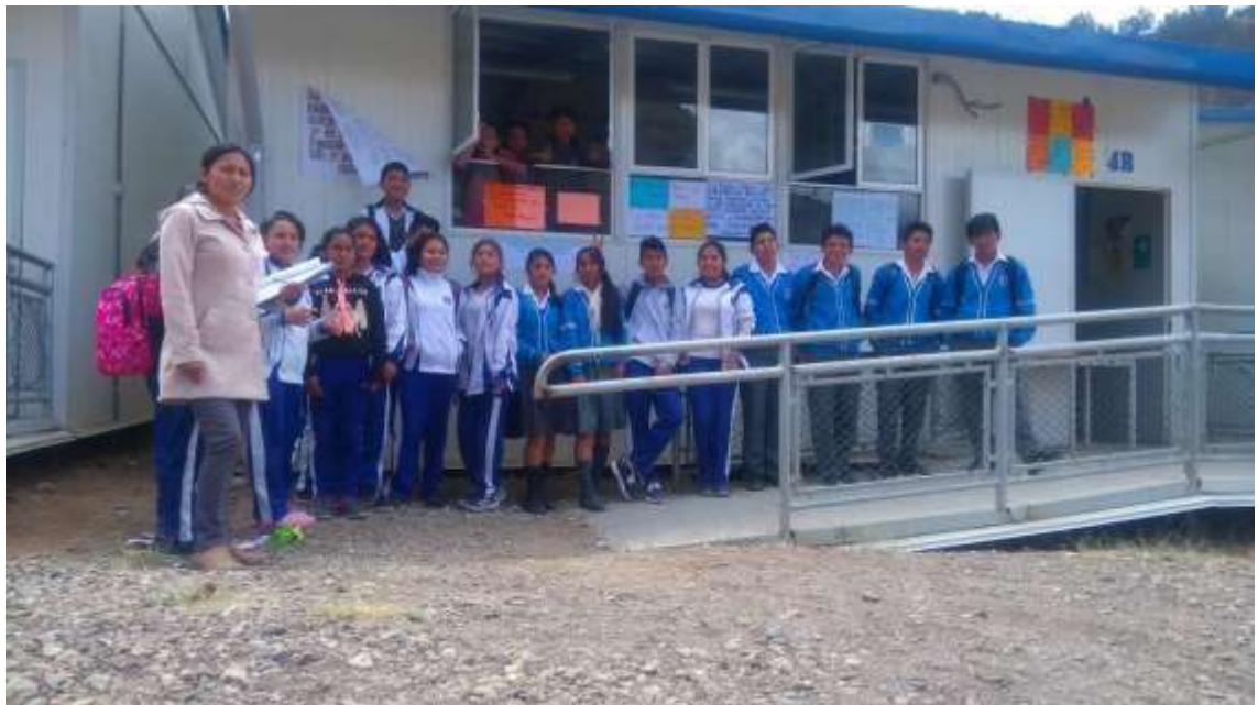
Imagen 3: Estudiantes de la Institución Educativa “Cap. Marcelino Valverde Solórzano, Sihuas Ancash, resolviendo las preguntas del instrumento de evolución.